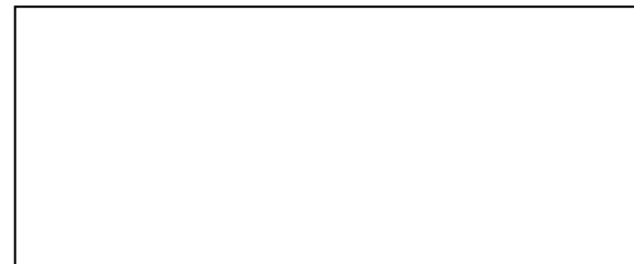
写真1 写真タイトルの例

する。この様式は、視覚障害者がテキスト読み上げソフトを用いるときに、読み上げている場所の確認や希望する箇所に移動する際に必要な情報を含んでいる。なお、章の区切りは1行空行を挟むこととする。章と節・項の間は、空行を挟まない。書式を統一するのは、学会の論文集としての形式を整え、論文を読みやすくするための一つの手法である。また、本概要集は各種の補助デバイスを用いる方を前提とし、補助デバイスの使用を容易にするためにも書式の統一に協力をお願いする。