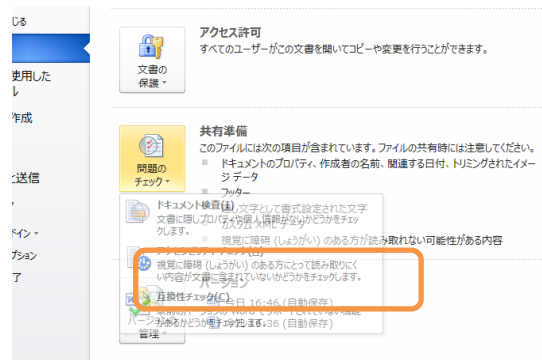
図 2 アクセシビリティチェック画面